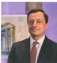
Mario Draghi Presidente della Banca centrale europea

Sin dalla loro introduzione nel 2002 le banconote in euro sono uno degli strumenti di pagamento più sicuri al mondo. Per preservare la fiducia dei cittadini, la serie "Europa" è stata dotata di elementi di sicurezza all'avanguardia.